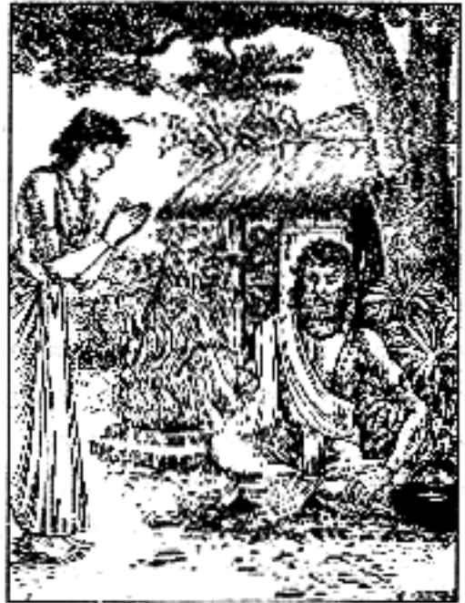
गुरुकी यह आज्ञा पाकर जब शान्ति नामक

सदा संलग्न रहनेवाले, सदाचारी और उदार शिष्य पुनित्वर शान्तिते कहा—'वत्स! मैं अपने भाई सुवर्चिके यज्ञमें जाऊँगा। उन्होंने मुझे बुलाया है। तुम्हें वहाँ आश्रमपर रहना है। यहाँ तुम्हारे लिये जो कर्तव्य है, सुनो। मेरे आश्रमपर तुम्हें प्रतिदिन अग्निको प्रज्वलित रखना होगा और सदा ऐसा प्रयत्न करना होगा, जिससे अग्नि बुझने न पाये।'