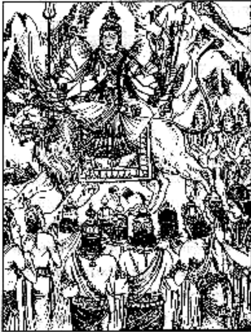
ब्रह्मिन्-वाच ॥ ३८ ॥

इति प्रसादिता देवैर्जगतोऽर्थे तथाऽऽत्मनः । तथेत्युक्त्वा भद्रकाली बभूवन्तर्हिता नृप ॥ ३९ ॥ इत्येतत्कथितं भूप सम्भूता सा यथा पुरा । देवी देवशरीरिभ्यो जगत्त्रयहितैषिणी ॥ ४० ॥