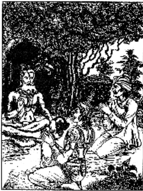
ऋषिरुवाच ॥ ४६ ॥

ज्ञानमस्ति सपस्तस्य जन्तोर्विषयगोचरे ॥ ४७ ॥ विषयश्च महाभाग याति चैवं पृथक् पृथक् । दिवाग्धाः प्राणिनः केचिद्रात्राग्धास्तथापरे ॥ ४८ ॥ केचिद्विवा तथा रात्रौ प्राणिनस्तुत्वदृष्टयः । ज्ञानिनो मनुजाः सत्यं किं तु ते न हि केवलम् ॥ ४९ ॥ यतो हि ज्ञानिनः सर्वे पशुपक्षिमृगादयः । ज्ञानं च तन्मनुष्याणां यत्तेषां मृगपक्षिणाम् ॥ ५० ॥ मनुष्याणां च यत्तेषां तुत्वमन्यतथोभयोः । ज्ञानेऽपि सति पश्येतान् पतङ्गाञ्छावचञ्चुषु ॥ ५१ ॥ कणामोक्षाद्गुताग्धात्पौड्यमानानपि क्षुधा । मानुषा मनुजव्याघ्र साभिलाषाः सुतान् प्रति ॥ ५२ ॥ लोभात्प्रत्युपकाराय नन्वेतान् किं न पश्यसि । तथापि ममतावर्ते मोहगर्ते निपातिताः ॥ ५३ ॥ महामायाप्रभावेण संसारस्थितिकारिणो । तत्रात्र विस्मयः कार्यो योगनिद्रा जगत्पतेः ॥ ५४ ॥ महामाया हरेर्ज्ञेया तथा संमोह्यते जगत् । ज्ञानिनामपि चेतांसि देवी भगवती हि सा ॥ ५५ ॥